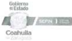
TABULADOR DEL PERSONAL DE PROGRAMAS (EVENTUAL) MANDOS MEDIOS Y SUPERIORES VIGENCIA A PARTIR DEL 01 DE FEBRERO DE 2023