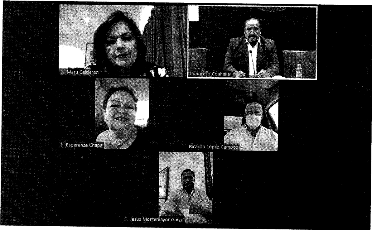
Imagen correspondiente a la reunión de trabajo llevada a cabo de manera híbrida el 25 de agosto de 2021 por la Comisión de Asuntos Fronterizos del Congreso del Estado de Coahuila de Zaragoza.